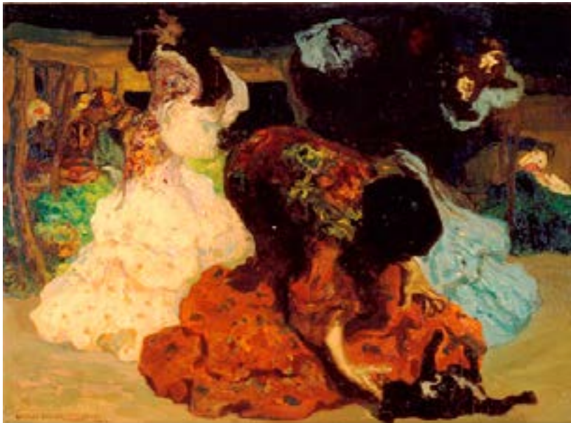
Investigación y sensibilización intergeneracional sobre la situación de la mujer gitana en España